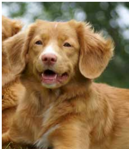
Nova scotia duck tolling retriever

kallade linjetag, kunna följa dirigeringar och övas i markering – att memorera var fåglar fallit och kunna hämta in dem i jägarmässig ordning. Dessutom behöver den tränas i att vara lugn när andra hundar arbetar. Träningen är något de flesta retrieverägare ser som en del av nöjet med att ha en hund av denna typ, och möjligheten att gå kurs och att träna ihop med andra är stor oavsett var i landet man bor.