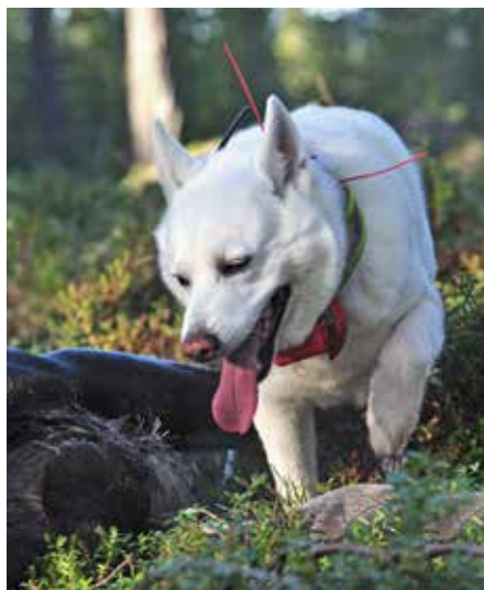
Svensk vit älghund

De ställande hundarna föds i princip utan undantag upp för jakt. Ett bra råd är att kontrollera föräldrarnas jaktprovsmärken och framför allt att försäkra sig om att de används för jakt på det viltslag man själv tänkt att jaga. Som familjehund är den ställande hunden vänlig och social, och många hundar bor idag tillsammans med sina familjer i hemmet, inte i hundgården.